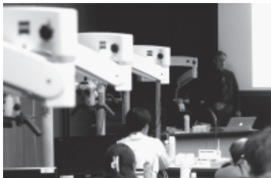
図 3 プレコンgressコース実習風景