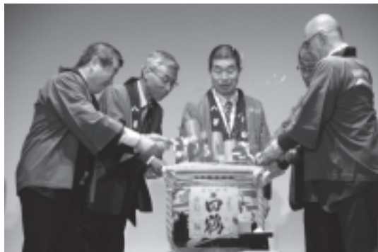
図 16 ガラディナーでの鏡割り