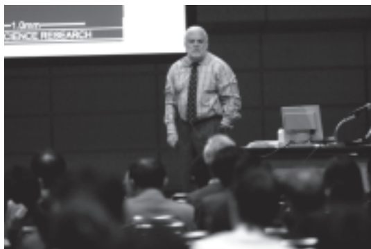
図 2 プレコンgressコースでの講演