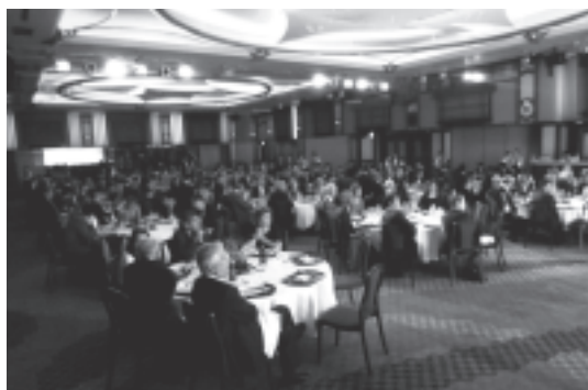
図 17 ガラディナー風景