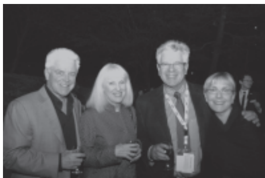
図 15 ガラディナー前の日本庭園での談笑