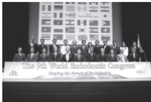
図 22 国際学会実行委員会の記念写真

(図 20). 閉会式では JEA エンブレムが第 35 回日本歯内療法学会学術大会大会長となる新潟大学興地隆史教授に引き継がれ (図 21), 4 日間の 3 学術学会併催大会に幕を閉じた (図 22).