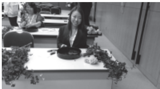
図 14 文化プログラム 華道