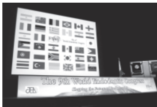
図 7 開会式 (参加国の国旗一覧)

に始まった (図 6~9)。開会式に続いてテキサス大学サンアントニオ校教授であり、Journal of Endodontics の Editor である K. Hargreaves 先生の基調講演が行われた (図 10)。大きな第 1 会場の 1 階席はすぐに満席となり、参加者を 2, 3 階席へと誘導するという盛況ぶりであった。その後 3 日間にわたり大会は 4 会場に分かれて講演が行われた。特に初日は、午後 8 時まで講演が続くというハードスケジュールながら充実した内容で進行した。本大会は世界歯内療法会議がメイン