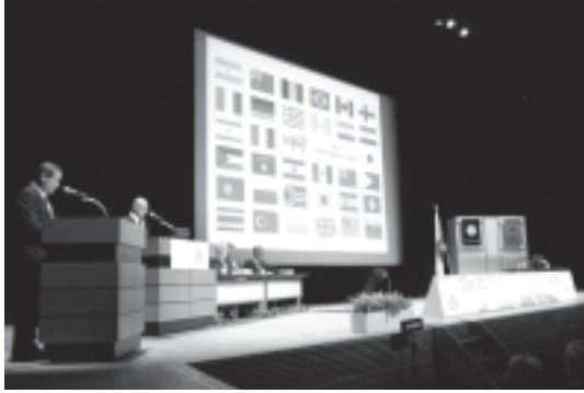
図 8 開会式