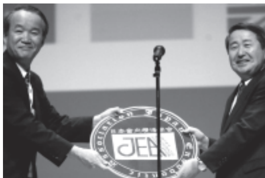
図 21 JEA エンブレムの引き継ぎ