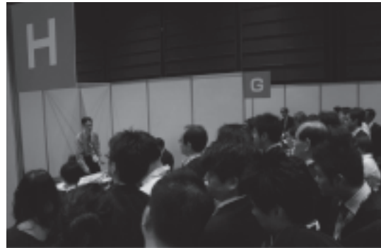
図 13 テーブルクリニック

ク(図13)が行われ、会場は大いに盛り上がった。また、ランチレクチャーも3コース設定され、会期中はエンド漬けといってもいい状態であった。また、東京都、東京観光財団の協力を得て、海外からの参加者のために無料ツアーや文化プログラムも行われた(図14)。