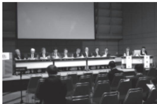
図 18 JEA 総会