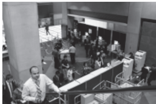
図 6 大会初日朝 続々と参加者が会場へと向かう