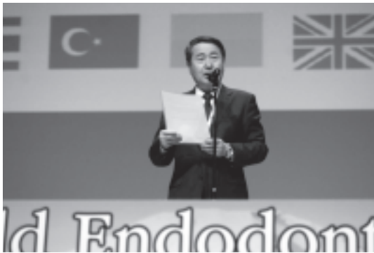
図 9 開会挨拶