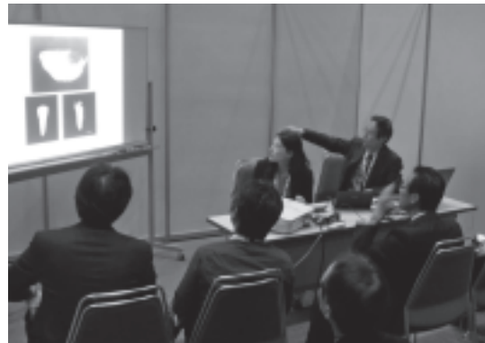
図 12 クリニカルケースプレゼンテーション風景