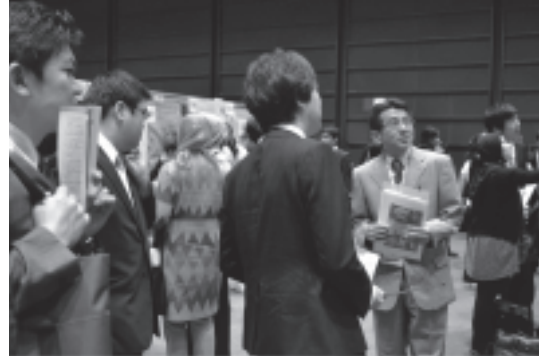
図 11 ポスタープレゼンテーション風景