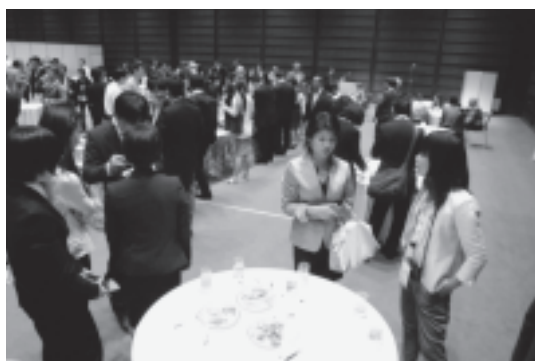
図 4 ウェルカムレセプションでの談笑