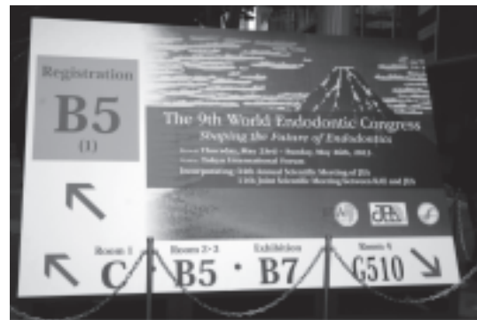
図1 東京国際フォーラム1階の看板

大会の成否は参加者数である。本大会では48カ国からの参加を得ることができ、国内1,000名以上、海外500名以上が参加した。この参加者数は予想を大き