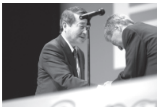
図 20 閉会式における赤峰昭文 JEA 会長からの感謝状贈呈

途中、日本舞踊、和太鼓演奏などのアトラクションもあり、美味しい料理とお酒に舌鼓を打ちつつ、盛り上がりを見せ瞬く間にお開きとなった（図 17）。